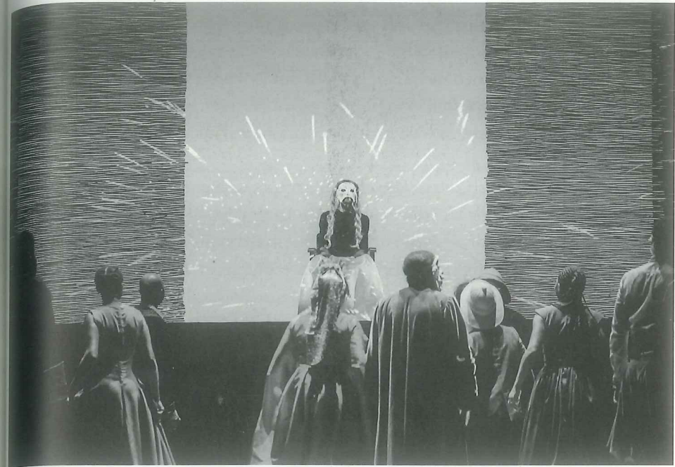
OS NEGROS, DE JEAN GENET, ENC. ROGÉRIO DE CARVALHO, TEATRO GRIOT, 2017 (TMSL), [F] ESTELLE VALENTE

Os Negros apresentam-se como um teatro dentro do teatro. Arquibaldo, mestre de cerimónias, encenador, anuncia que um grupo de negros se reuniu ali para entreter o público (que se supõe na sua maioria branco). Agradece a sua presença e passa à apresentação das personagens. A ação desenrola-se em dois planos. No primeiro plano, num plano térreo, numa arena ou terreiro, irá ser reconstituído o assassinato da rapariga branca por um negro, num plano superior, a assistir estão as forças do poder e da aculturação, estereótipos civilizacionais: a Rainha, o Juiz, o Escudeiro, o Missionário e o Governador. Estes são atores negros que usam máscaras brancas. Estão em oposição ao público e de certa forma serve-lhe